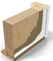
Innerdør EI30/ dB35