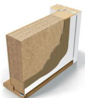
Innerdør EI30/ dB35