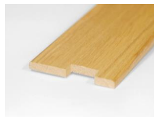
Terskel 9 mm