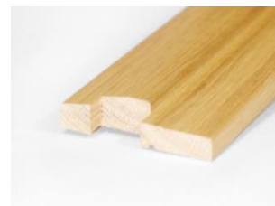
Terskel standard (HC)